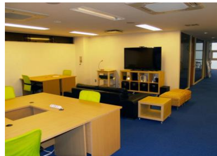
「Garage labs<ガレージラボ>」 ( http://garage-labs.jp/ )

道内では昨年11月に道内初のコワーキング・スペース「Garage labs<ガレージラボ>」が札幌市内にオープン。この他にも新たなスペースの開設の動きがある。